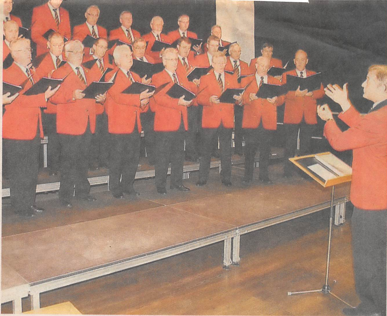
Der Männerchor „Eintracht“ Reuth bei seinem Auftritt